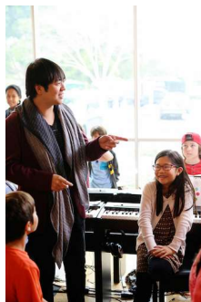
Foto-, Video- und Pressematerial finden Sie zum Download auf der Webseite des Haus der Musik unter www.hausdermusik.com/presse-1